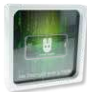
FRAME MEDIA CON BIGLIETTO